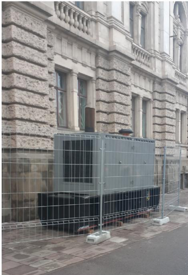
Großer Generator für das Opernhaus Lwiw