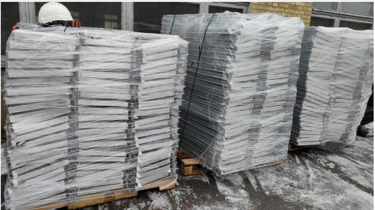
Angekauftes Zubehör für die Installation der Solaranlage zur Stromversorgung des Museumskomplexes in der Kyiw-Petschersk-Lawra (Höhlenkloster)