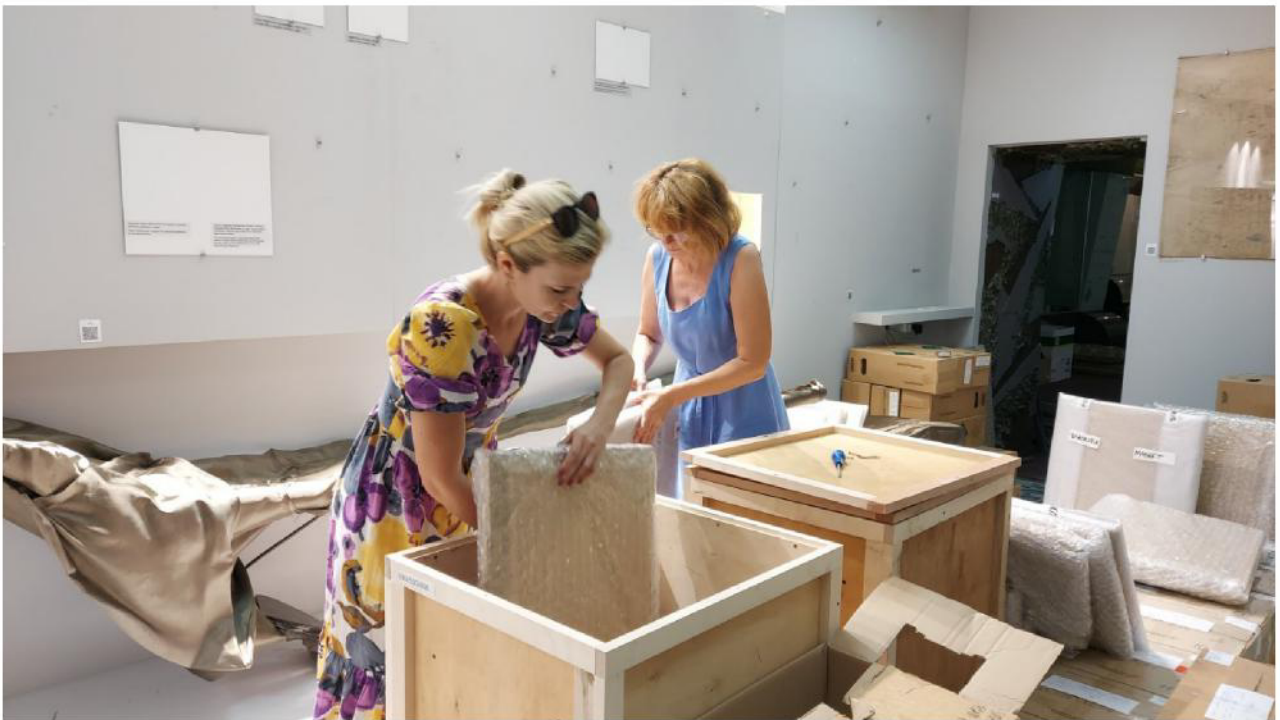
Historisches Museum in Pokrowsk. Umverpackung und Vorbereitung der Sammlung für die Teilvakuumierung