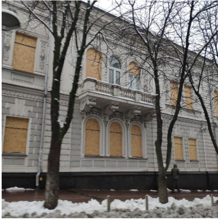
Kyiv, Taras Schewtschenko Museum. Fensterabdeckung mit OSB-Platten nach dem Drohnen-Beschuss der Innenstadt am 10.10.2023