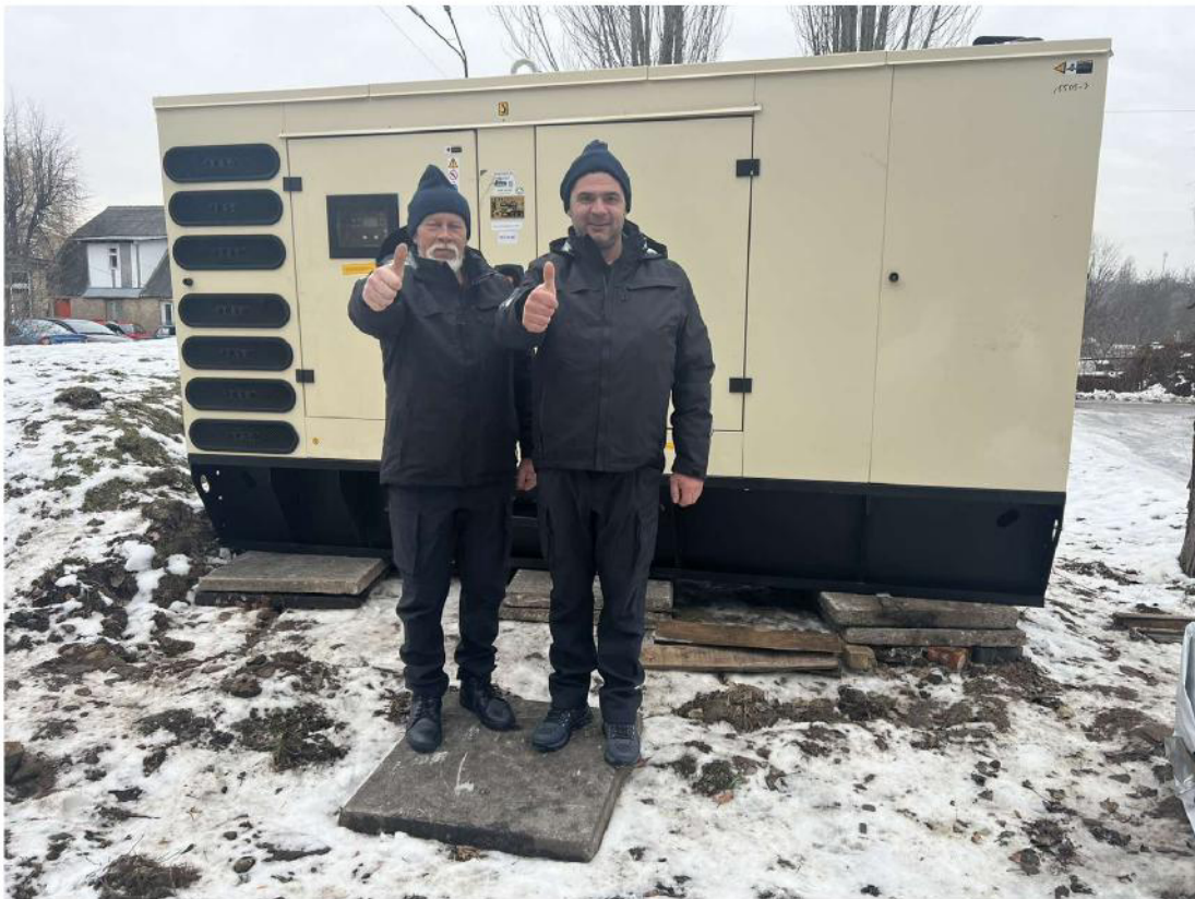
Museum für Volksarchitektur und Brauchtum in Pyrohiw bei Kyiw - Anlieferung des großen Notstromgenerators und der warmen Arbeitskleidung für Mitarbeiter:innen