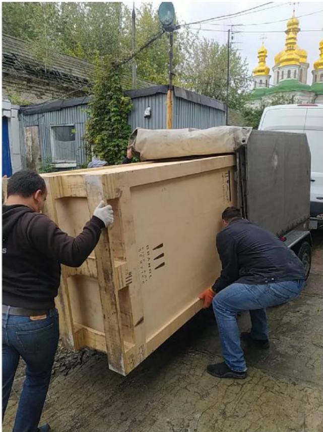
Verladung der Transportkisten für die Perejaslaw-Museen im Lager im Kyiwer Höhlenkloster