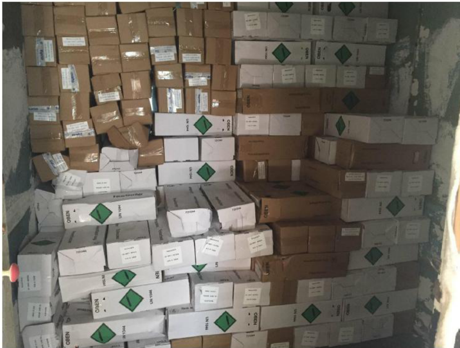
Lieferung von Feuerlöschern im Museum für Volksarchitektur und Brauchtum in Pyrihiw bei Kyiw