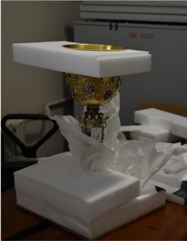
Verpackung der Sammlung der Schatzkammer in der Kyiw-Petschersk-Lawra (Museumsareal Höhlenkloster). Auf dem Foto ein Beispiel für die Verwendung von speziellem Restaurierpapier (Mikalentpapier)