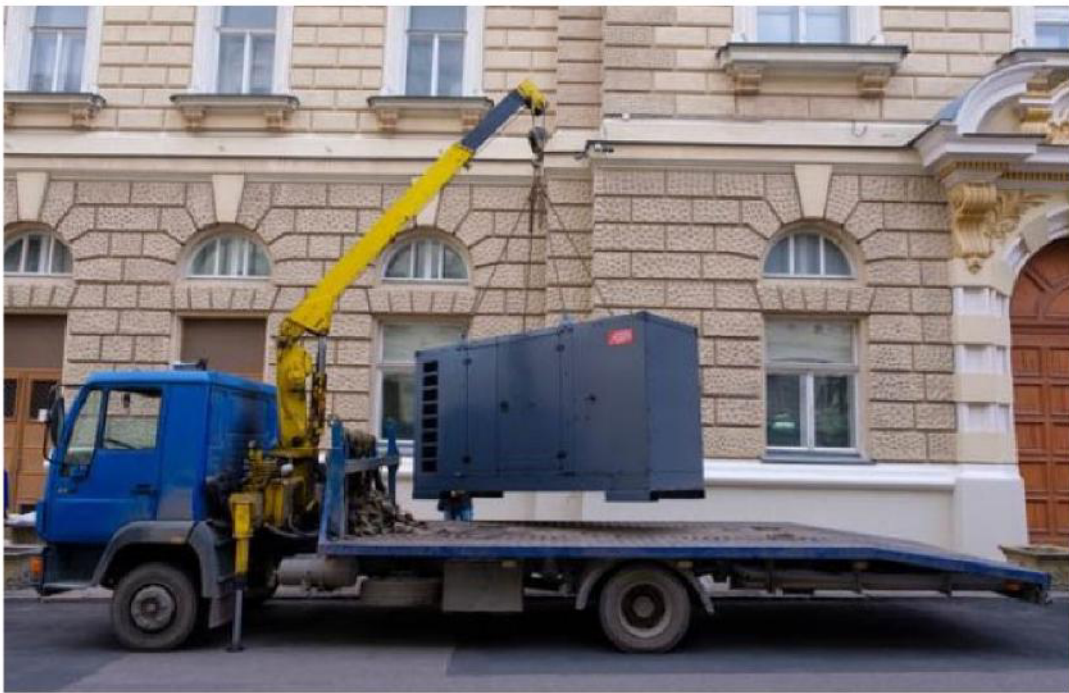
Lieferung des großen Generators für das Opernhaus in Odesa