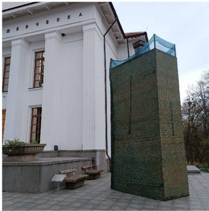
Schewtschenko Nationalreservat in Kaniw, Schutzeinschalung des Taras Schewtschenko Denkmals mit OSB-Platten