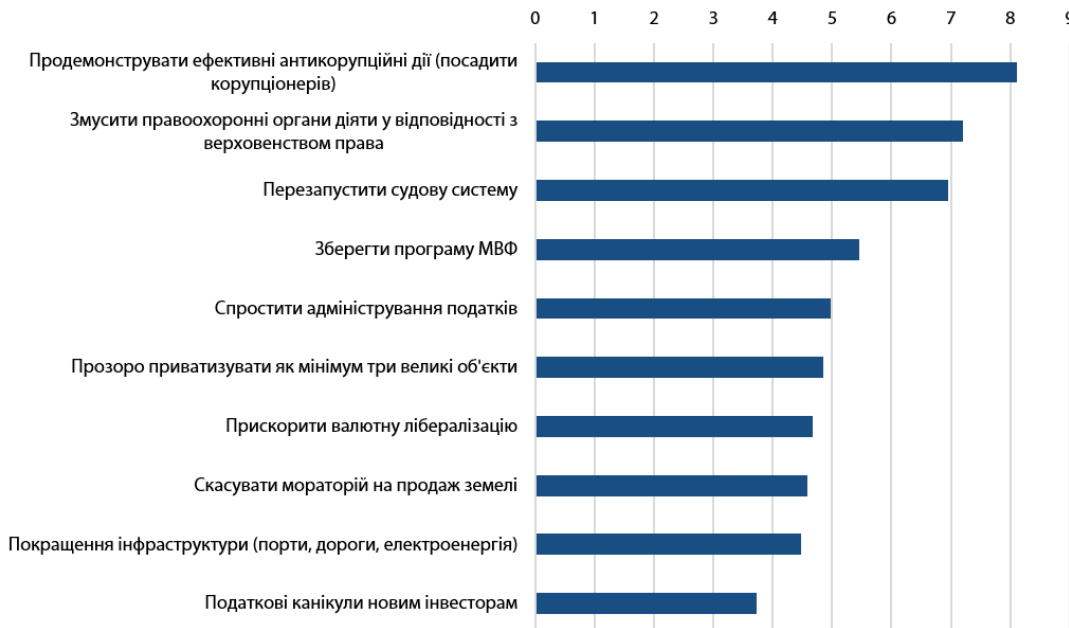
Рис. 3. Оцініть наступні можливі дії уряду з точки зору їх позитивного впливу на притік іноземних інвестицій (10 - найпозитивніший вплив)

«На жаль, відсутність верховенства права, корупція в судах і правоохоронних органах продовжують нівелювати заклики керівництва країни інвестувати і створювати робочі місця в Україні», – коментує Томаш Фіала , генеральний директор Dragon Capital .